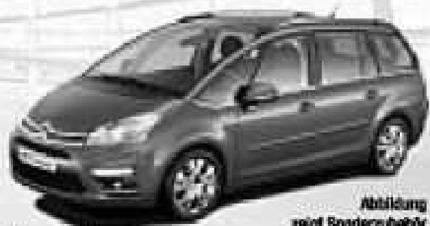
Abbildung zeigt Sonderzubehör